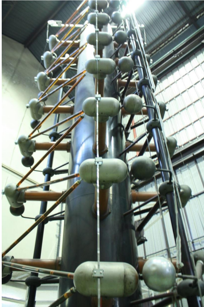
Le générateur de chocs dans sa configuration de décembre 2017