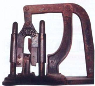
Ancien modèle fabriqué à 84 Courthézon